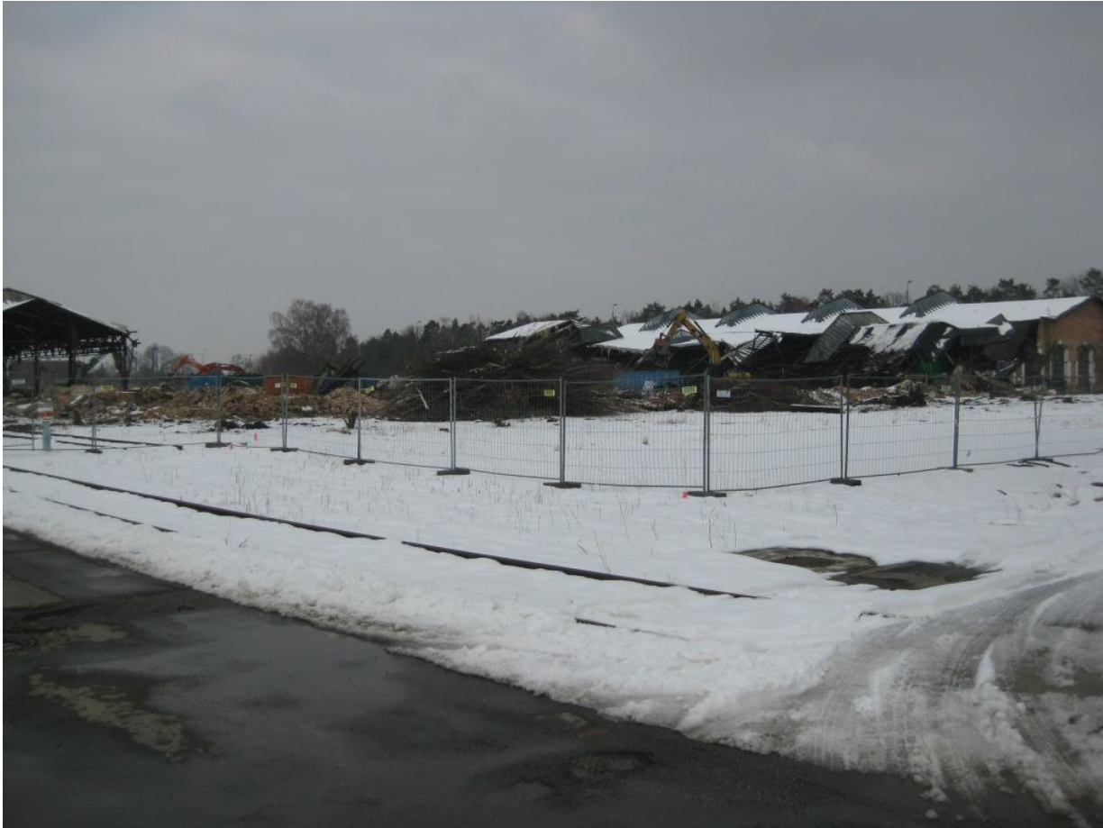
War das der „Ostflügel“ mit den 6 Hallen?