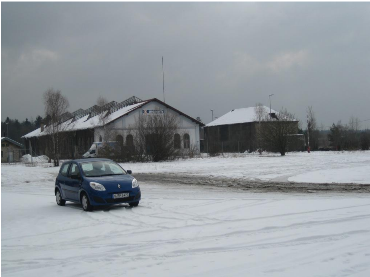
Menathalle und Bunker